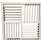
Grelha 4 Saídas