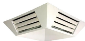
Difusor Quadrado 4 Saídas