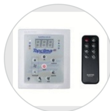
Central Inversora (Opcional)